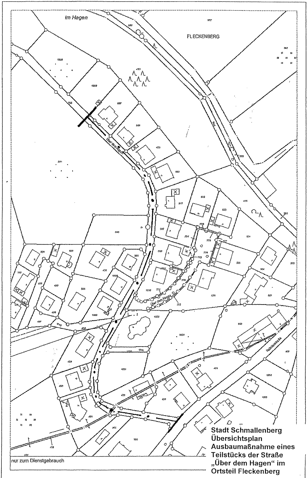
Stadt Schmallenberg Übersichtsplan Ausbaumaßnahme eines Teilstücks der Straße „Über dem Hagen“ im Ortsteil Fleckenberg